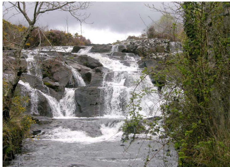
A fervenza en augas baixas