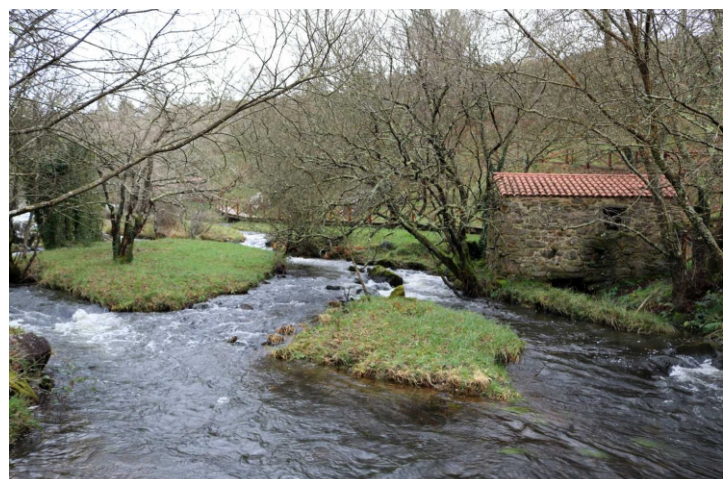
O río Mira na área fluvial