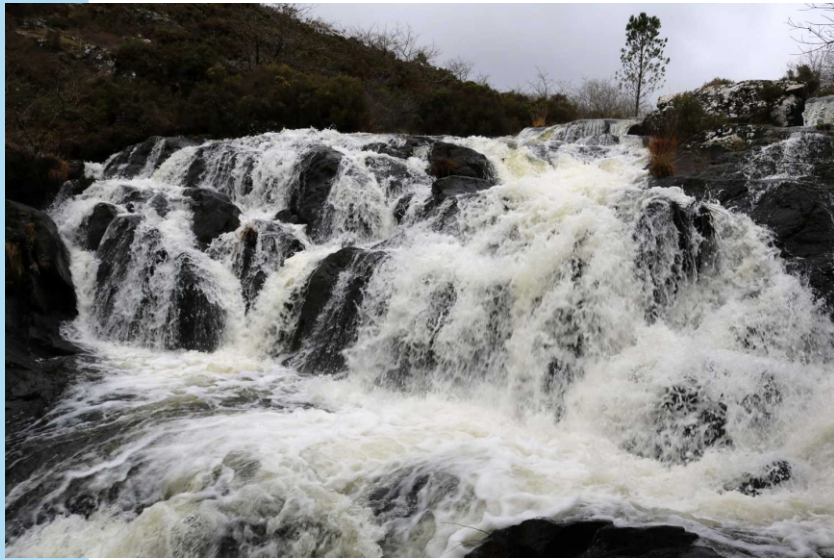
Vista xeral da fervenza de Castriz

Na área fluvial remata unha das rutas do programa “Coñece o teu concello”. A que comeza en Bazar, e despois de pasar polas fontes do Xallas e o monte Castelo, remata ao pé da fervenza. Un percorrido lineal duns 14 km.