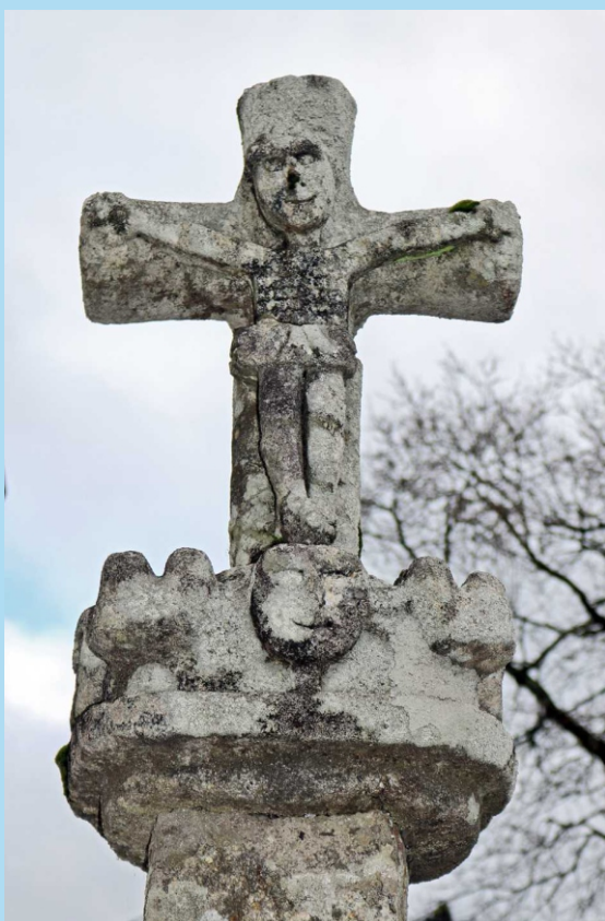
Detalle do cruceiro de Castriz