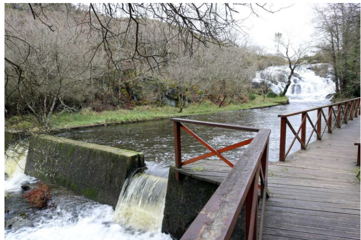
Zona acondicionada para o baño